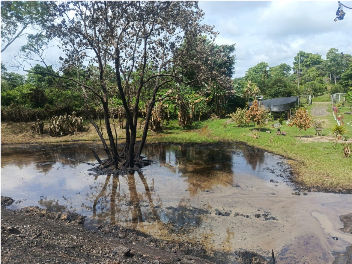
Foto tomada el 30 de octubre de 2024 sobre las 3 de la tarde. Corresponde al estado del Vivero Aroma y Salud ubicado en la vereda Planta Nueva.

CREDHOS Corporación Regional para la Defensa de los Derechos Humanos "Hoy como ayer, persistiendo por la vida y la dignidad" NIT. 800.079.235-6