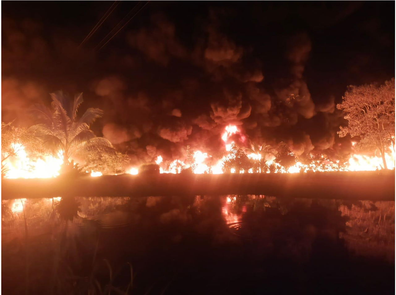
Foto tomada en la madrugada del 30 de octubre de 2024. Corresponde a las inmediaciones del Vivero Aroma y Salud ubicado en la vereda Planta Nueva del corregimiento El Centro de Barrancabermeja.

Lo anterior, evidencia situaciones en Barrancabermeja con ocasión del conflicto armado interno. De manera que, estamos ante una situación que vulnera Derechos Humanos y en el ámbito de aplicación del Derecho Internacional Humanitario (DIH), esta acción bélica presuntamente del ELN constituye una infracción al DIH por afectación a población civil, en este caso, la comunidad de la vereda Planta Nueva del corregimiento El Centro de la ciudad de Barrancabermeja.